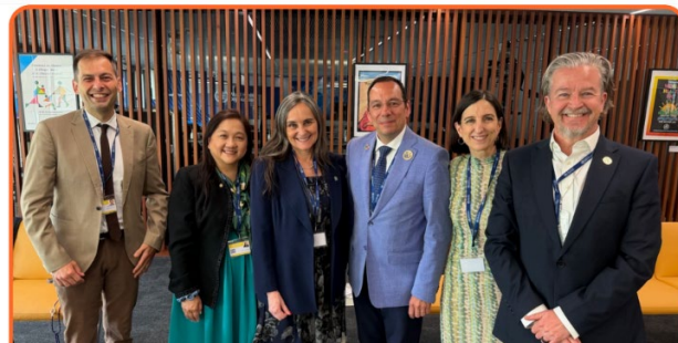
Le président et le directeur générale du CII en compagnie du président et des dirigeants de l'Organisation mondiale des médecins de famille (WONCA).