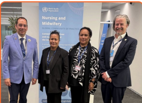
Le président et le directeur générale du CII en compagnie de responsables infirmiers de Palau.