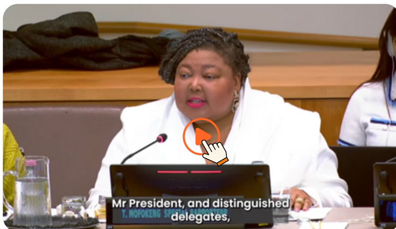
Le Rapporteuse spéciale des Nations Unies sur le droit à la santé reconnaît la campagne #NursesforPeace du CII.

La campagne #NursesforPeace (Infirmières pour la paix) du CII a été reconnue par la Rapporteuse spéciale des Nations Unies pour le droit à la santé comme un exemple de bonnes pratiques dans la fourniture de « ressources humanitaires essentielles, de soutien en santé mentale et de formation à la préparation aux situations d'urgence et au leadership ». C'est ce qui ressort du rapport « Les travailleurs de la santé et des soins : les gardiens et les défenseurs du droit à la santé », présenté à l'Assemblée générale des Nations Unies.