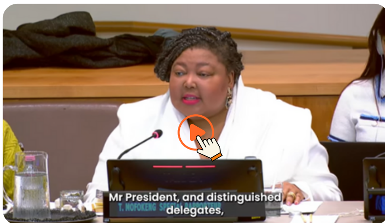
La relatora especial de las Naciones Unidas para el derecho a la salud reconoce la campaña #NursesforPeace del CIE

La campaña #NursesforPeace (Enfermeras por la Paz) del CIE fue reconocida por la Relatora Especial de las Naciones Unidas para el Derecho a la Salud como un ejemplo de buenas prácticas en la prestación de «recursos humanitarios esenciales, apoyo a la salud mental y formación en preparación para emergencias y liderazgo». Así se recoge en el informe «Trabajadores sanitarios y asistenciales: los juramentados y defensores del derecho a la salud», presentado ante la Asamblea General de las Naciones Unidas.