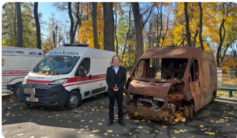
El director general del CIE, Howard Catton, frente al Ministerio de Salud de Ucrania, rodeado de ambulancias calcindas y acibilladas a balazos.

A lo largo de 2025, el CIE ha profundizado y reforzado su labor humanitaria y la campaña #NursesforPeace en todos los niveles. Esto ha abarcado desde la labor en materia de políticas globales hasta el apoyo directo al personal de enfermería y las asociaciones nacionales de enfermería (ANE) que se enfrentan a retos inimaginables, e incluye nuestro primer programa de liderazgo para la recuperación y la respuesta ante crisis llevado a cabo en una zona de guerra activa (Ucrania).