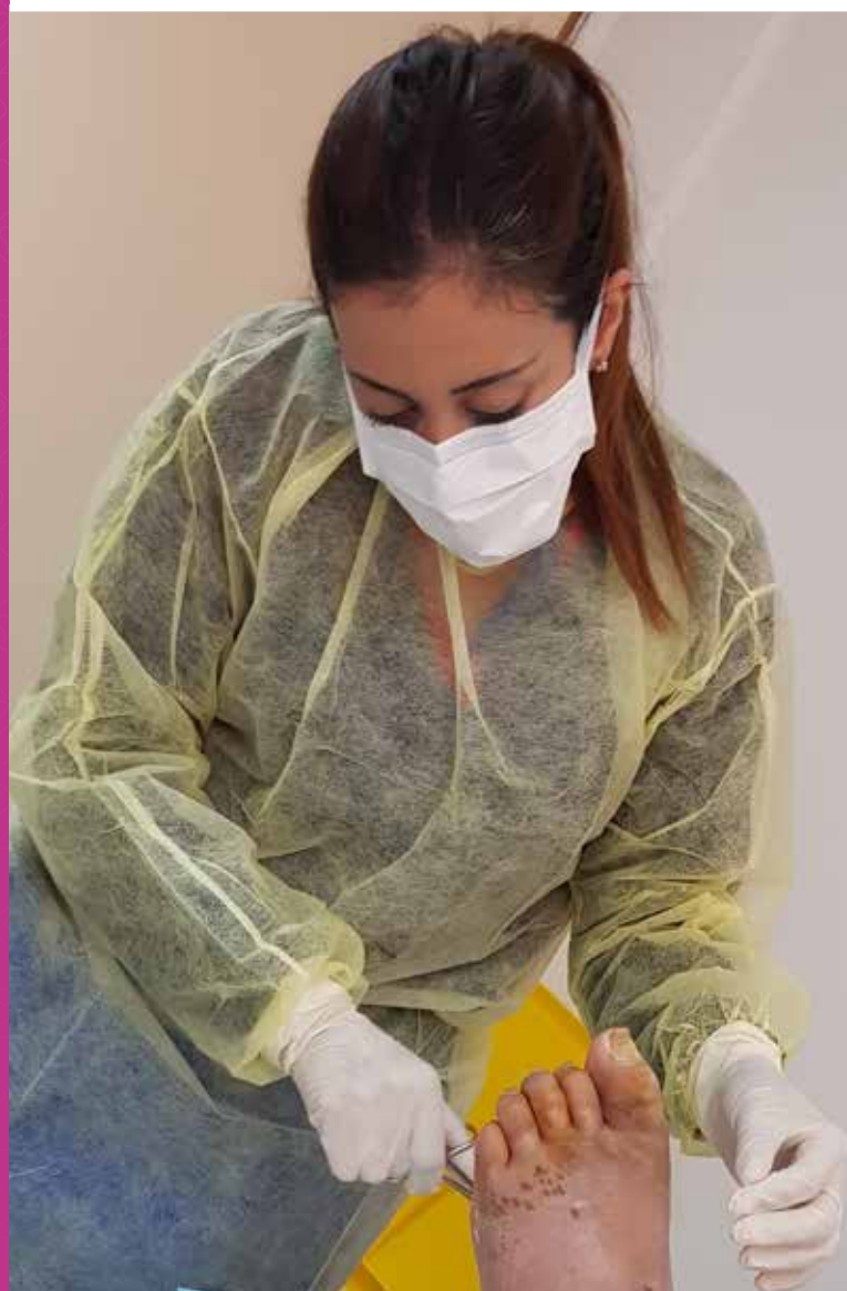
Une infirmière traite une blessure à l'hôpital de Bar Elias, au Liban.

De plus, nous constatons les effets positifs de notre engagement à traiter l'état global des patients et non pas uniquement leur maladie. Au cœur du programme, les infirmières apportent leurs connaissances, leur expertise technique, leur jugement et leurs relations interpersonnelles avec les patients et les familles : telles sont les clefs du succès du traitement des plaies dans notre hôpital.