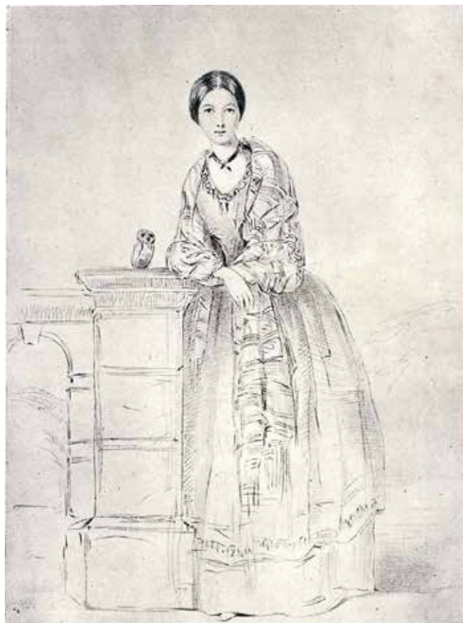
Melle Nightingale et sa chouette apprivoisée, Athéna, vers 1850, d'après un croquis de Parthenope, Lady Verney.

Enfin, Florence Nightingale préconiserait une approche intergénérationnelle, dans laquelle des dirigeants jeunes et plus âgés seraient formés ensemble aux méthodes d'organisation et aux compétences d'influence politique. Ensemble, ces cheffes de file, nouvelle génération de Nightingales, mèneraient la charge en faveur des soins infirmiers conçus comme un mouvement mondial pour le bien social.