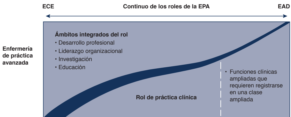
Figura 2: Cómo distinguir a la enfermera clínica especialista de la enfermera de atención directa

Fuente: Bryant-Lukosius, D. (2004 y 2008). The continuum of Advanced Practice Nursing roles . Documento sin publicar.