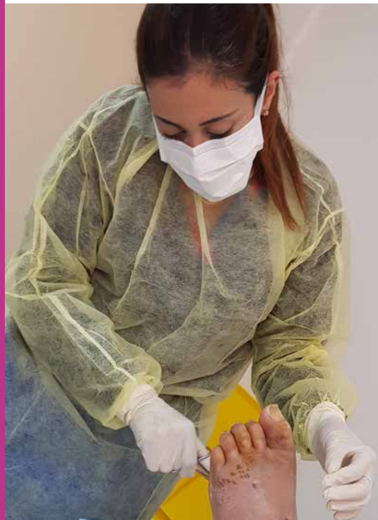
Una enfermera curando una herida en el Hospital de Bar Elias, Líbano

Asimismo, estamos viendo el resultado de nuestra dedicación al tratar a los pacientes en su conjunto y no simplemente como una enfermedad. Las enfermeras están en el corazón del programa gracias a su conocimiento, pericia técnica, juicio y a las relaciones interpersonales que mantienen con los pacientes y sus familias. Son la base del éxito del programa de cuidado de heridas de nuestro hospital.