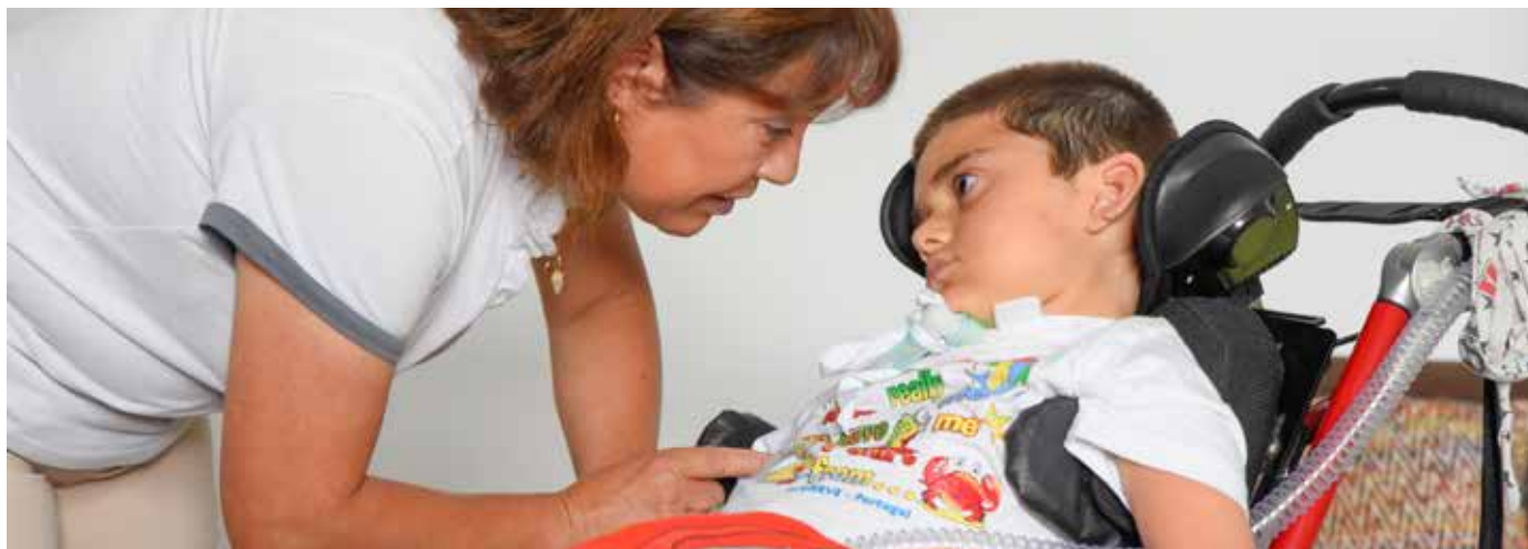
Kastelo es la primera unidad pediátrica de cuidados paliativos en la península ibérica. Un equipo de enfermeras y pediatras prestan cuidados a un máximo de 30 niños con enfermedades crónicas

Una de las paradojas de la atención a las personas al acercarse al final de la vida, incluso en los países en los que hay recursos y evidencia en relación con los cuidados paliativos, es que estos servicios siguen estando infrautilizados. Algunos autores 43 han argumentado al respecto que, en particular en los países con una buena dotación de recursos, la prevalencia de procesos biomédicos plantea el riesgo de excesiva medicalización de los cuidados paliativos perdiendo así su base holística esencial. Las enfermeras desempeñan un importante papel de defensa de cara a prevenir estas tendencias y garantizar que los avances científicos que sostienen las intervenciones paliativas se siguen basando en las necesidades y deseos de la persona, su familia y su comunidad. Las enfermeras pueden garantizar que se escucha la voz de la persona y la comunidad en el proceso de prestación de cuidados y puede defender la asignación de suficientes recursos para garantizar que no se dejan de lado los aspectos humanos al dispensar atención. Aportando esta perspectiva holística a los cuidados al final de la vida en todas las comunidades y entornos, las enfermeras proporcionan la esperanza de que siga prosperando un sistema de atención completa e integral a medida que avanza nuestro conocimiento sobre los cuidados paliativos y afrontamos la inevitable y creciente demanda de este tipo de servicios en todo el mundo.