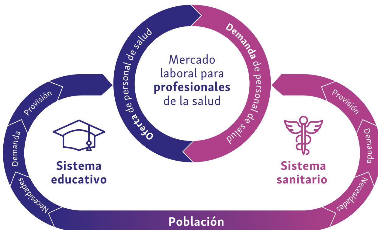
Figura 1: Intersección entre formación, mercados laborales y sector salud