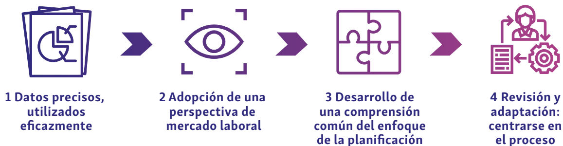
Figura 2: Cuatro condiciones para una buena planificación de la fuerza laboral

1 Ningún país puede aspirar a realizar una planificación eficaz sin un sistema de información de recursos humanos que permita modelar y probar políticas y ofrezca soporte a los planificadores, educadores y gestores para la planificación, reclutamiento, remuneración, formación y despliegue del personal de enfermería. Normalmente, se debe contar con indicadores sobre demografía, educación y empleo. 120 El punto de partida debe ser una auditoría de la actual fuerza laboral de enfermería y la información relacionada.