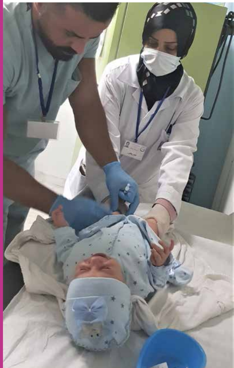
Mejorando la cobertura de la inmunización en Líbano

Como resultado de este servicio y los cambios realizados por las enfermeras, hasta 10 000 personas al año provenientes de comunidades desatendidas y pobres están siendo vacunadas, lo cual equivale a un incremento del 400% respecto a años anteriores.