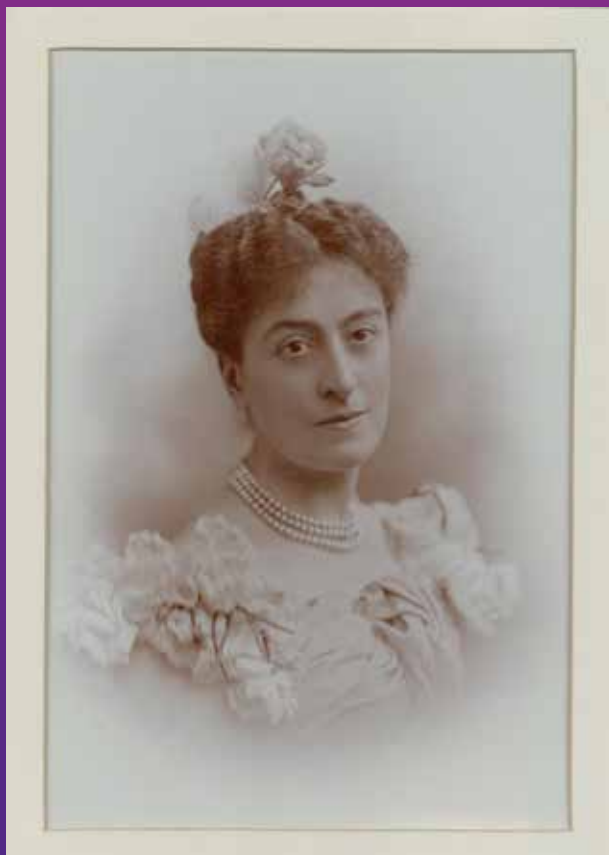
Sra. Ethel Gordon Bedford Fenwick, Reino Unido, Presidenta, Consejo Internacional de Enfermeras, 1900 - 1904

'La profesión de enfermería requiere en este momento, por encima de todo, organización: las enfermeras en este momento, por encima de todo, han de estar unidas. El Gobierno de este país y de otras naciones civilizadas reconoce el valor de la labor que realizamos con los enfermos a día de hoy. Sin embargo, lograr que el trabajo de las enfermeras sea de máxima utilidad para los enfermos depende de ellas mismas a título individual y colectivo y es algo que solo se puede lograr si su educación se basa en unas líneas tan amplias que el término enfermera formada equivale a persona que ha recibido una formación tan eficiente y ha demostrado ser merecedora de tanta confianza que las obligaciones y responsabilidades que ha de asumir las puede cumplir con el máximo beneficio para aquellos encomendados a su cuidado. Para alcanzar estos resultados, hay dos aspectos esenciales: debe haber sistemas reconocidos de formación en enfermería y debe haber control sobre la profesión de enfermería. La experiencia del pasado ha demostrado que ninguna profesión puede alcanzar estos resultados a no ser que esté unida para exigir las reformas necesarias, y únicamente mediante la unión se podrá obtener la fuerza necesaria.' 10, p.7