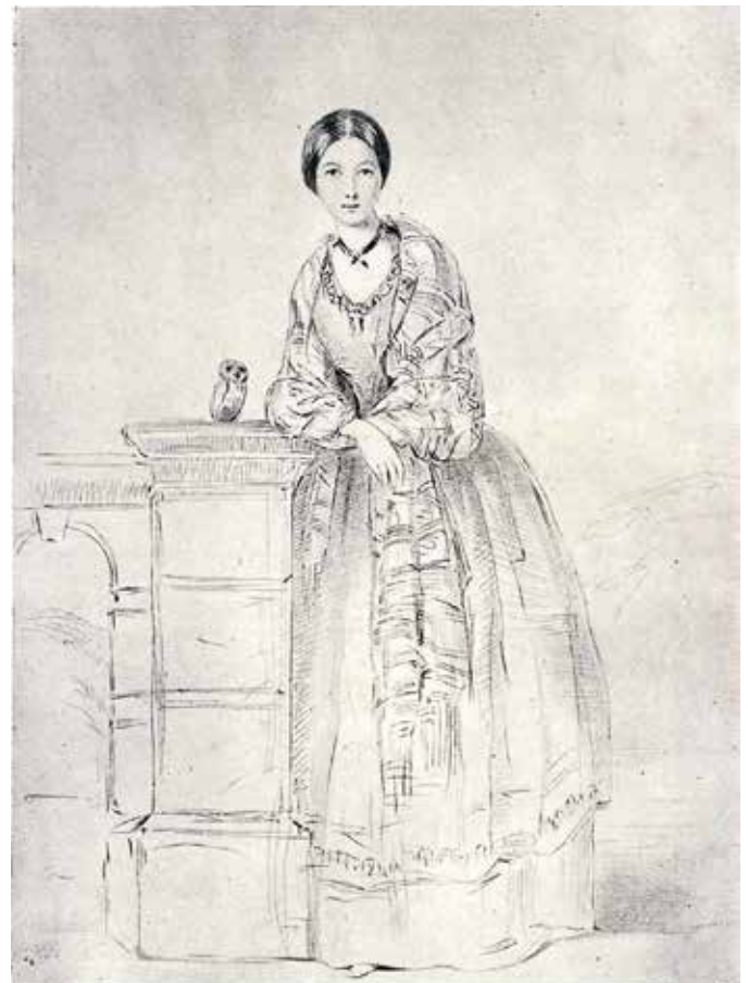
La Sra. Nightingale con su búho domesticado Athena, alrededor de 1850 – A partir de un dibujo de Parthenope Lady Verney

Por último, instaría a un planteamiento intergeneracional en el que los líderes jóvenes y los más mayores se formarían juntos en métodos organizativos y habilidades para influir en la política. Juntos, actuarían como los Nightingales de nueva generación que liderarían la ofensiva y convertirían la enfermería en un movimiento social mundial por el bien social.